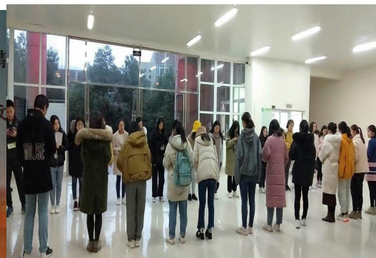
英语 S. E. S 晨读团