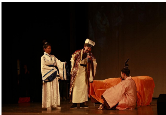
国学话剧《屈原》演出