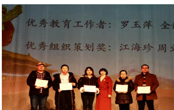
学院优秀教师颁奖