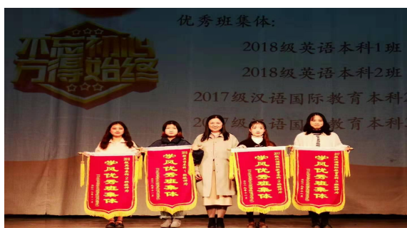
学院优秀学风班集体奖项颁奖

研究生 24 人。近年来学院完成省部级市厅级项目课题 20 余项，发表论文 100 余篇，其中核心期刊论文 8 余篇，出版专著教材 5 部，师生获省级以上奖 60 余项。