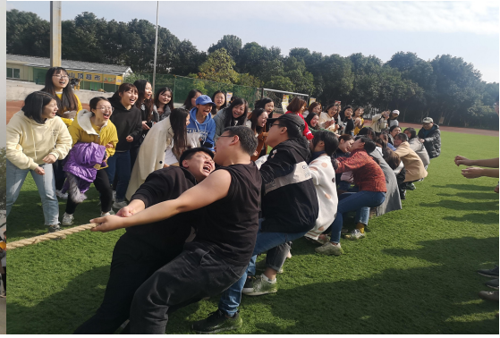
学院冬季拔河比赛