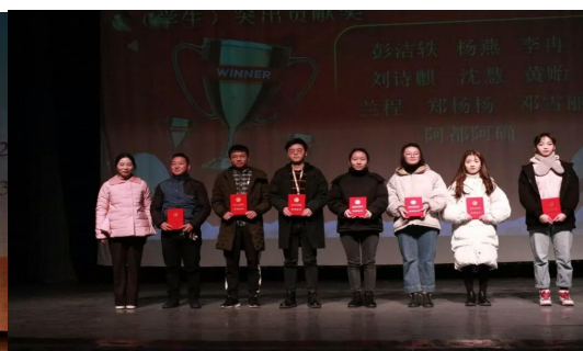
学院特殊贡献奖奖项颁奖