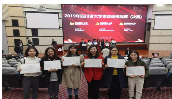
参加英语挑战赛获得二等奖