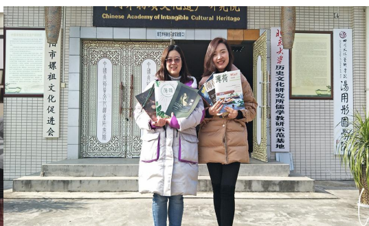
英语编撰英文杂志《薄荷》12期